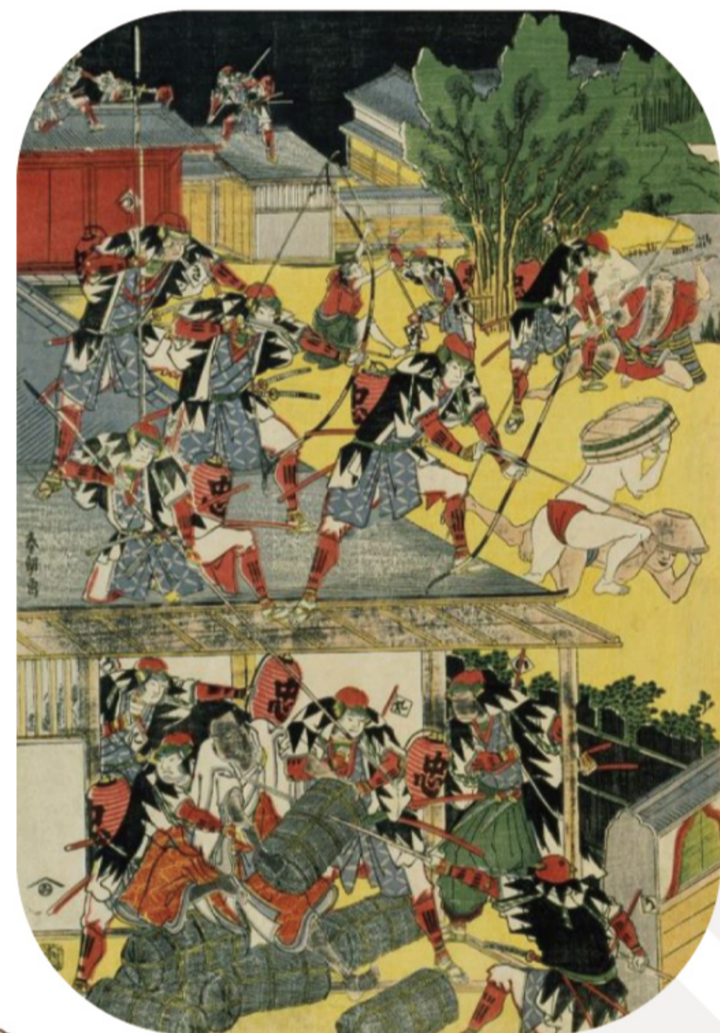
「忠臣蔵討入」(大判三枚続) すみだ北斎美術館蔵

「吉良邸討ち入り」集結地のひとつ、堀部安兵衛の剣術道場はこの辺りにあった。ここから安兵衛らが、杉野十平次宅や前原伊助宅を出発した浪士と共に、表門と裏門の両門から吉良邸へ討ち入ったのは元禄15年12月14日寅の刻。明け方には討ち取りの合図が鳴り響く…。吉良邸まではわずかな距離だが、「松の廊下事件」から1年と9か月、ここに至るまでの道のりは、長く、険しいものであったにちがいない。