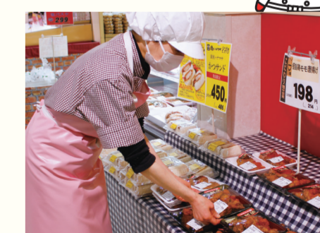
消費期限などの表示を確認します。

衛生管理の実施記録は、食品ごとの部門長が責任を持って記入しています。きちんと記録が残されていると、何か確認