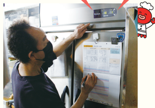
冷蔵庫の温度を確認し、記録します。

HACCPは、宇宙食を製造する際の衛生管理の考え方が基になっています。宇宙で食中毒になっても病院には行けないため、宇宙食はより安全に製造されています。そんな環境でも通用する食品管理の方法に我々が取り組んでいることを、消費者の方に知ってもらい、安心して食品を食べていただきたいです。また、各家庭でもぜひ、実践してもらいたいと思います。