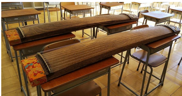
（錦糸中学校に配置した2面）