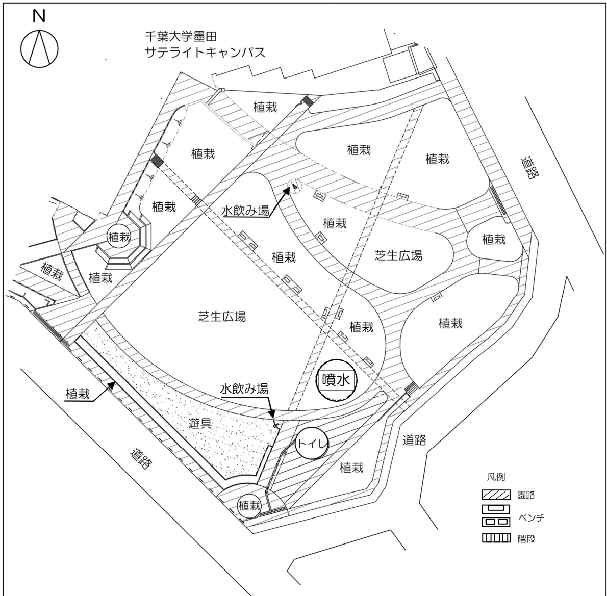
平 面 図