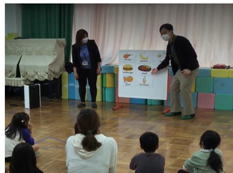
幼稚園での英語活動の様子