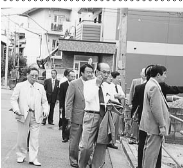
京島まちづくり用地