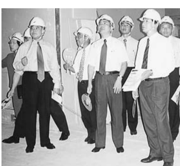
建設中の(仮称)国際ファッションセンター