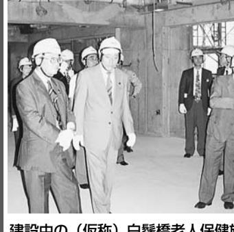
建設中の(仮称)白鬚橋老人保健施設