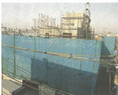
はなみずきホームの建築工事現場

条例 墨田区特別養護老人ホーム条例（区立として初めて、特別養護老人ホーム「はなみずきホーム」を設置するもの）原案どおり異議なく決定した。 陳情 「義務教育費国庫負担法」改正反対に関する陳情——各委員から「事務職員・栄養士の国庫負担が除外されるなら間接的に影響を受けるので、ぜひ採択を」等の意見が出され、「趣旨に沿うよう努力されたい」との意見を付して採択の上、執行機関に送付すべきものと異議なく決定した。