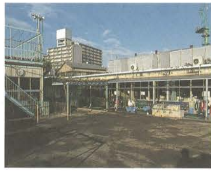
補修予定の押上保育園

議案 町区域の変更について、錦糸町駅北口地区再開発事業区域内の町区域を変更するもの