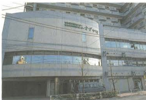
すみだ女性センター