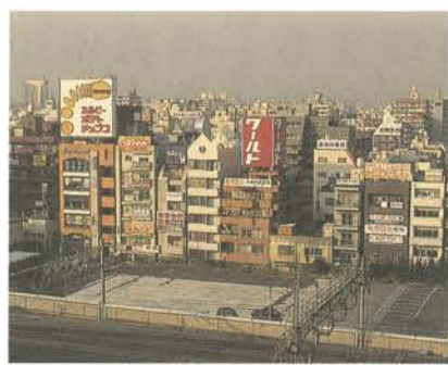
町区域を変更する錦糸町駅北口地区

議案 職員の給与に関する条例の一部を改正する条例(特別区人事委員会の給与勧告等)に伴い、職員の給与を改定するもの