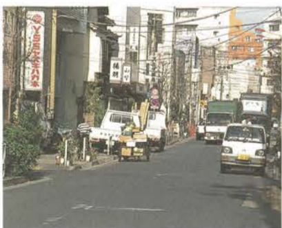
愛称名が決まった「見番通り」

報告 区道愛称名について、区民の親しみを増すため、昭和61年から進めている区道愛称名の選定について、既に選定している16区道に加え、今回新たに向島2-2から5-24までの間の区道を、地元の協力を得て「見番通り」と名付け、案内板を設置するもの。 江戸東京博物館建設工事について、新しい都民文化創造の拠点をめざし、現在建設工事が進められている東京都江戸東京博物館（横網二丁目）について、工事の進行状況の報告があった。