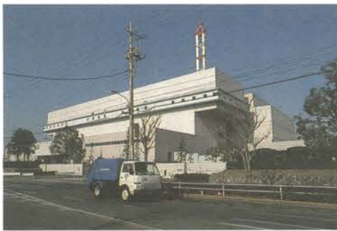
葛飾区内の清掃工場

問 先に、都が発表した清掃工場建設計画では、本区の東墨田一丁目の都用地が候補地としてあげられたが、清掃工場建設に