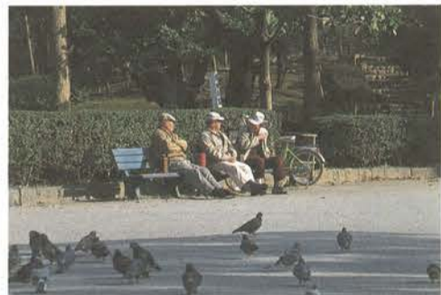
隅田公園でくつろぐお年寄り

に、さまざまな問題が発生しているが、区は、相談業務等を労働関係の行政機関だけに任せるのではなく、区としての相談業務が実施できるよう、女性センターの機能を見直し、相談窓口を設けるなど、より効果的な業務を行うことはどうか。