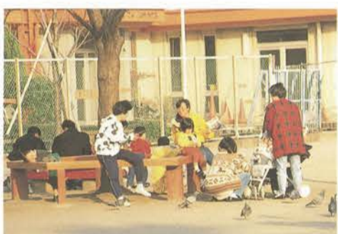
錦糸公園で過ごす親子

週休2日制の実現が求められている今、区民サービスの低下をきたさず、職員数も抑制するなかで、区はどのような検