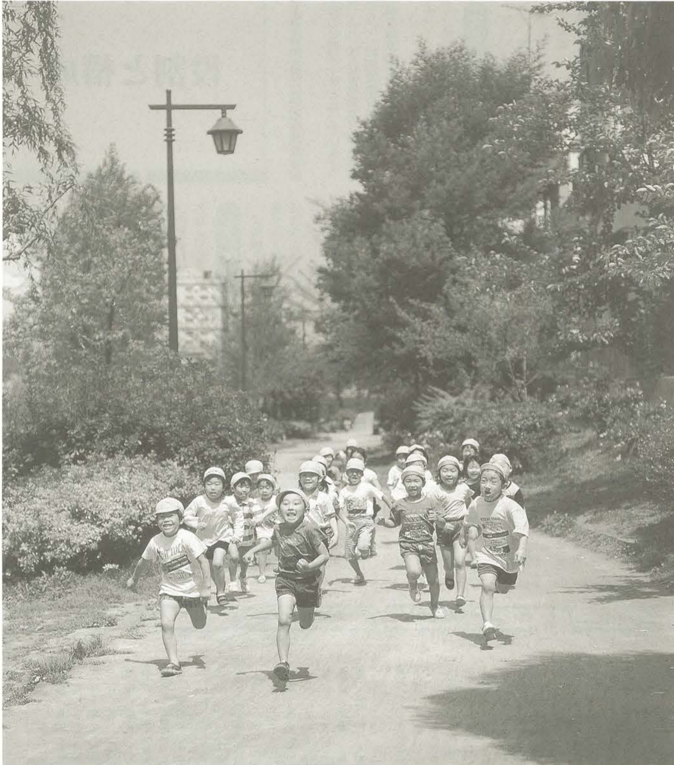
「未来に向かってよ〜いドン!」—大横川親水公園にて