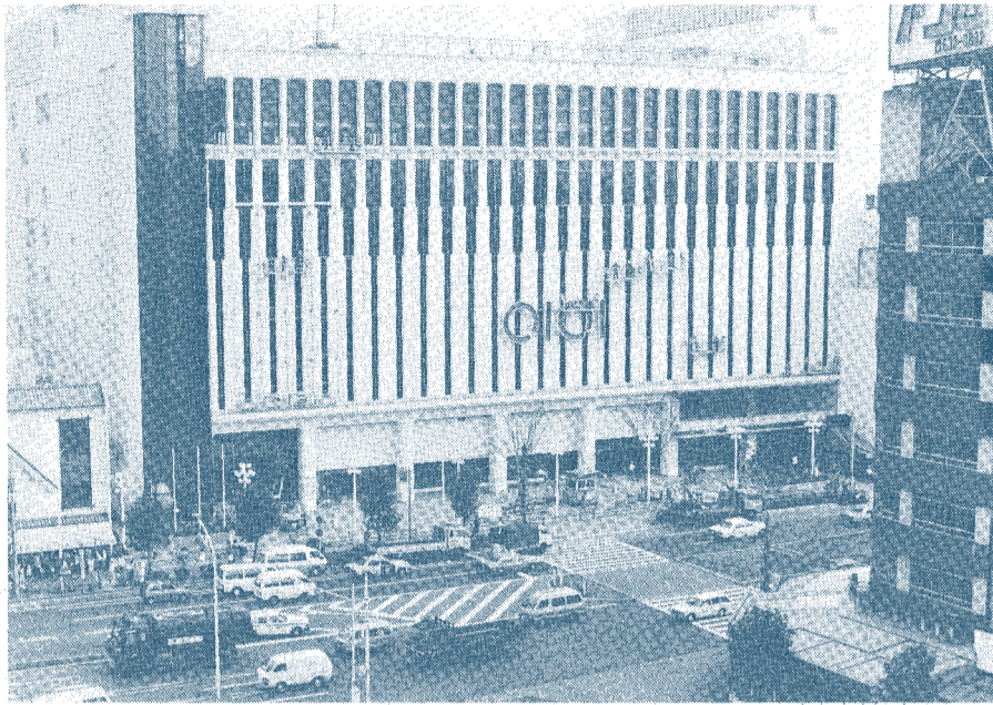
9月2日の開館をめざし、共同開発として準備が進む「産業会館」

この中で過去二期八年間の区政を振り返るとともに、今後四年間の区政運営の基本的考え方に ついて①墨田区基本構想に基づき、「人と緑と産業の調和した、安全、快適、豊かな町づくり」の推進、②効率的で清潔な信頼