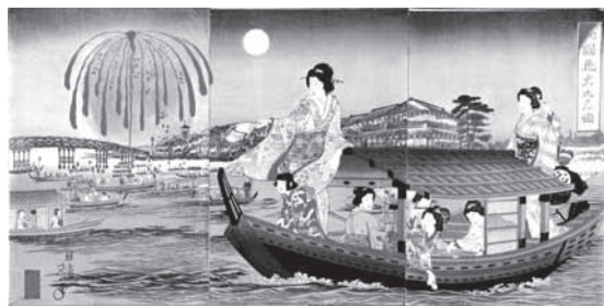
楊斎延一画「両国花火の三曲」

体障害者手帳 愛の手帳をお持ちの方は無料【申込み期間】直接会場へ【問合せ】すみだ郷土文化資料館 ☎5619-7034