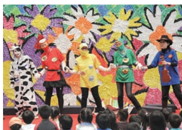
“食”について楽しく学んだり、考えたりしましょう。