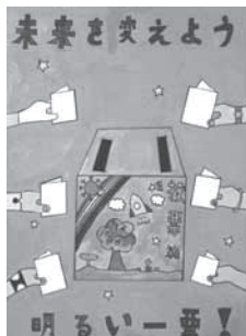
昨年度の小学生の部「墨田区最優秀作品」

児童・生徒の皆さんを対象に、「明るい選挙啓発ポスター」を募集しています。明るく、きれいな選挙を呼びかける、多くの作品をお待ちしていますので、奮ってご応募ください。 【対象】区内の小・中学校、高等学校、特別支援学校に在学する児童・生徒【画材】自由(絵の具、紙、布など)【規格】画用紙の四つ切り(542ミリメートル×382ミリメートル程度)、八つ切り(382ミリメートル×271ミリメートル程度)、またはそれに準ずる大きさ【審査発表】11月初旬(予定)【申込み】作品の裏面右下に氏名(ふりがな)・学校名・学年を記入し、