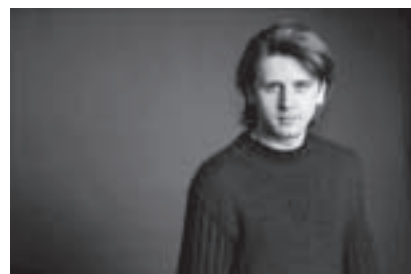
ヴィタリー・ピサレンコ