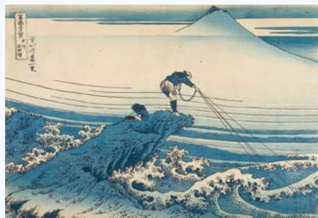
展覧会ポスター掲載作品