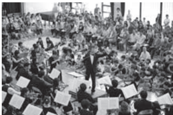
大盛況だった昨年のコミュニティ・コンサート

新日本フィルハーモニー交響楽団がホールを出て、あなたの街を訪れる毎年恒例の“コミ・コン”。今年は指揮者に伊藤 翔を迎え、楽しいお話や楽団員ソリストの演奏などで、本格的なオーケストラのコンサートをホールで聴くよりも身近に楽しんでいただけます。