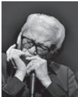
トゥーツ・シールマンズ

も活発な演奏活動を続けています。その演奏は世界中の宝物であり、今こそ皆さんに聴いていただきたい唯一無二のアーティストです。「みんな泣きたくなると僕を呼ぶんだ」と語る、その心揺さぶる音色と心に迫る歌を、ぜひ、お聴き逃しなく。