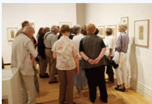
北斎展が開催されているベルリン市の美術館「マルティン・グロピウス・バウ」には、連日、多くの人が訪れています。