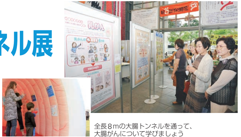
全長8mの大腸トンネルを通して、大腸がんについて学びましょう

9月は「がん征圧月間」、10月は「乳がん月間」です。区では、がんへの知識を深めるため10月3日～7日に「ピンクリボンイベント・がんパネル展」を、乳がん検診の受診率の向上をめざすため10月15日に「ウォーク&トーク フォー ブレストケア」を開催します。