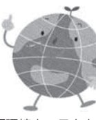
墨田区環境キャラクター 「地球くん」