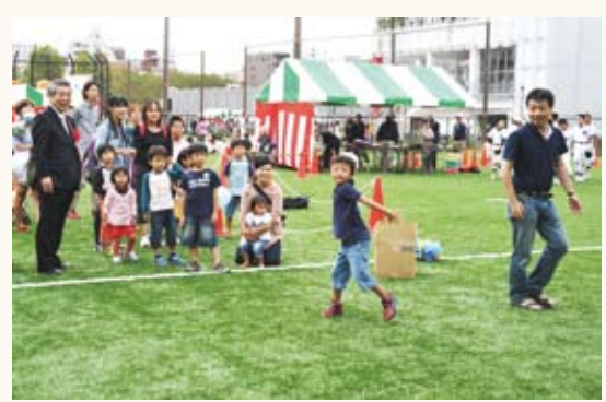
「すみだまつり・こどもまつり」では、たくさんのご家族にお会いしました

北国から初雪の便りが届く頃となりました。今年は冬も節電に取り組む必要がありますので、あまり寒くならないよう願っています。 さて、先月開催した「すみだまつり・こどもまつり」には、2日間で約29万人もの方々にご来場いただきました。被災地を支援する物産展や模擬店等をはじめ、各ブース・ステージとも大変な賑わいで、支えてくださった団体や区民の皆さんにお礼を申し上げます。 今年のおまつりで特に印象的だったのは、4月にリニューアルオープンした錦糸公園野球場で見かけた、皆さんのいきいきとした笑顔でした。グラウンド・ゴルフやボール遊びにチャレンジする親子、人工芝に寝転ぶ子どもたちなど、本当に皆さん楽しそうでした。