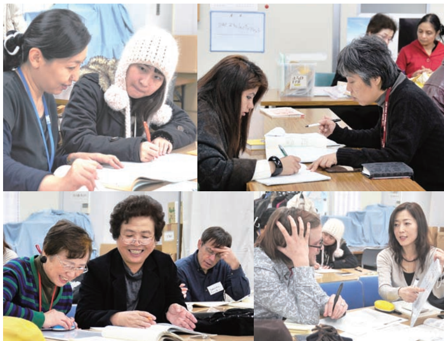
お互いの国の文化なども学び合います(日本語サークル「こんにちは!」の教室にて)

な地域づくりが、求められています。様々な国籍の人とともに暮らしやすい地域を築いていくためには、日ごろからお互いの文化を尊重し、違いを認め合う「多文化共生社会」の実現に向けた取組が大切です。そのため、区では外国語による相談窓口の開設や外国語版刊行物の配布などを行っています。また、国際化に向