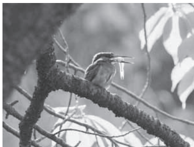
越冬する生きものたちに会いに行きましょう!

【申込先】1月12日午前10時から 催し名・希望の部・参加者全員の氏名・代表者の電話番号・メールアドレスを電話またはEメールで、すみだ環境ふれあい館(03611-6355) Kan