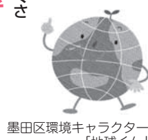
墨田区環境キャラクター「地球くん」