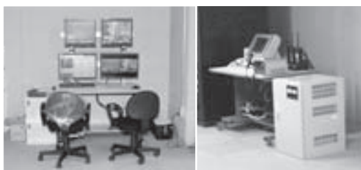
危機管理ベースに設置した、高所カメラのモニター(写真左)と防災無線装置(写真右)