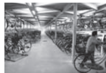
「当日利用」は1回50円です