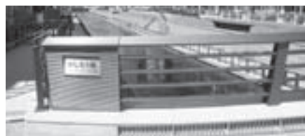
「押上」と「業平」から一文字ずつ取り、「おしなり橋」と名付けられました