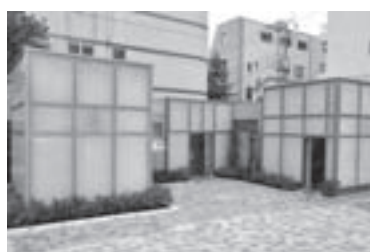
まち歩きトイレ業平橋の外観