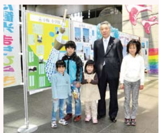
区立小・中学生が撮影したスカイツリー定点観測写真等の展示「ぼくらの、わたしたちの東京スカイツリー観察日記」を見学に来た子どもたち

青葉若葉が輝きに満ちた清々しい季節になりました。遠出を計画されているご家族も多いと思いますが、この時期は、ぜひ、区内の“まち歩き”を楽しんでみてはいかがでしょうか。 区では、楽しく散策していただくために、スカイツリー周辺の道路や大横川親水公園などを整備したほか、クーポン付きの「すみだ観光まる得ブック」や「おさんぽ案内帖」というガイドブックを墨田区観光協会などと共同で発行しました。区内には、魅力的なスポットがたくさんありますが、この春オープンした北十間川沿いの「おしなり公園」や再整備が完了した錦糸公園の「水と緑と花の広場」は、親子でくつろげる新しい憩いの場としてお勧めです。また、“天窓からスカイツリー