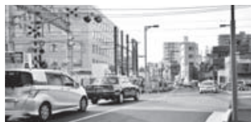
第2号踏切の撤去をめざします

【主な交通対策】交差点の改良、車線の増設、信号交差点の設置、駐車場の整備、駐車場案内看板の設置、誘導員の配置、公共交通機関利用の周知、観光バス対策、駐車場情報の提供【問合せ】都市整備課事業推進担当 ☎5608 - 6281 *鉄道立体交差事業に関することは立体化推進担当 ☎5608 - 6263へ