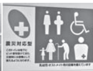
分かりやすいピクトでご案内