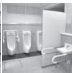
快適なトイレ空間