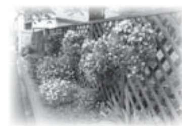
草花の世話をする人のやさしさも伝わってくるハンギングバスケット(イメージ)