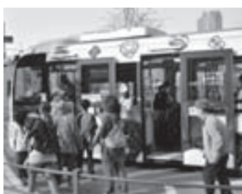
「すみだ百景 すみまるくん・すみりんちゃん」は、3つのルートで運行中

【運賃】 ▶大人(中学生以上) = 100円 ▶小児(小学生) = 50円 ▶乳幼児 = 無料 【問合せ】 新タワー調整課新タワー調整担当 ☎5608 - 1470 *運行に関すること(運賃・路線・時刻表等)については、京成バス(株)奥戸営業所 ☎3691 - 0935 へ