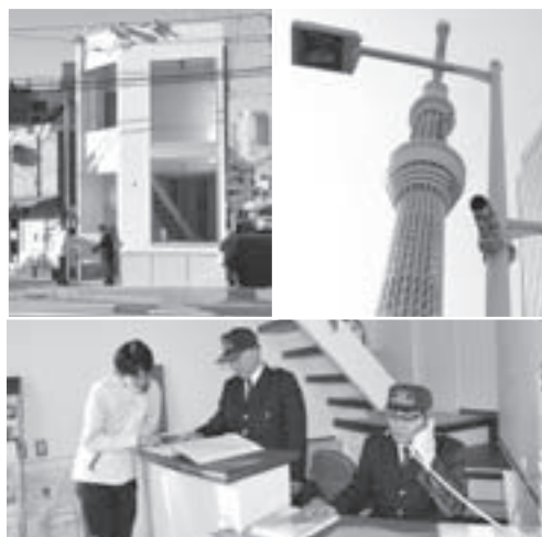
(写真左上) すみだ防犯センターの外観、(写真右上) まちの安全を守る防犯カメラとLED街路灯、(写真下) 警察官OBによる親切で丁寧な対応

地域の防犯拠点として、「すみだ防犯センター」を設置し、経験豊かな警察官OBが地域の安全と安心の確保を図ります。