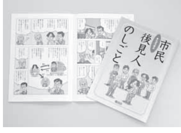
市民後見人の仕事について、漫画を使って分かりやすく紹介した冊子を、問合せ先で無料配布しています