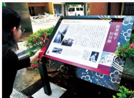
小説家・佐多稲子の旧居跡にある「歴史散策案内板」 * 「歴史散策案内板」の14か所の設置場所等については、「向島町おこしの会」のホームページをご覧ください。

る「すみだの誇り」です。ぜひ、皆さんも、合計14か所ある「歴史散策案内板」を巡りながら、向島に息づく文化や歴史を感じてみませんか。