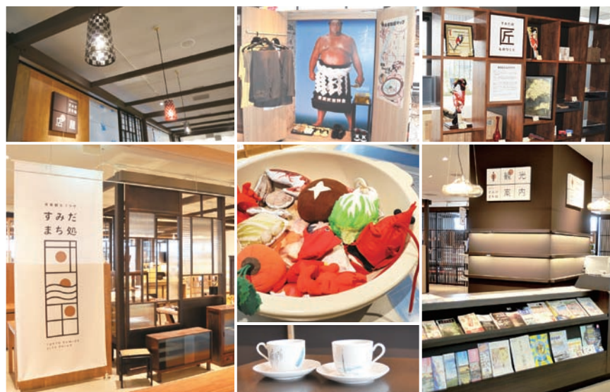
すみだの粋を感じられる館内の様子(中央は「ちゃんこ鍋」の具材をモチーフにした展示物)

な工夫がされています。また、訪れる度に新たな発見と出会うよう、年間20回以上の企画展等を区内団体・組合、区等が開催します。年中無休の「すみだ まち処」へ、お越しただき、区について楽しみながら知り、“粋なすみだ通”になりましょう。 【問合せ】新タワー調整課新タワー調整担当 ☎5608-1470