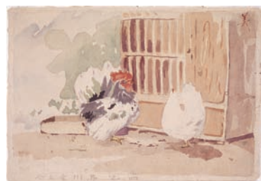
府立第三中学校在学中に描いた水彩画「ちゃぼ」(日本近代文学館所蔵)