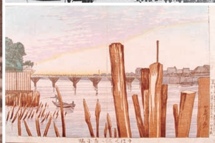
[左] 龍之介の肖像写真(日本近代文学館所蔵)、[右上] 龍之介の遊び場だった回向院の境内に完成した最初の国技館(緑図書館所蔵)、[右下] 龍之介がよく眺めていた両国の百本杭が描かれている、小林清親画「千ぼんくひ両国橋」(すみだ郷土文化資料館所蔵)