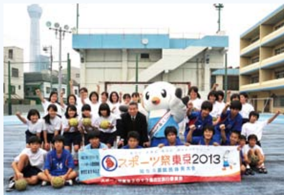
「みんなで国体を盛り上げよう!」文花中学校ハンドボール部の生徒さんたちと

今年の夏は、ロンドンオリンピックで活躍するトップアスリートに、熱い声援を送っている方も多いのではないのでしょうか。同じくアスリートが集う大会として、来年秋に、東京では54年ぶりの国民体育大会が開催されます。37種目の正式競技のうち、墨田区ではハンドボール競技の成年男子の部が区総合体育館で行われます。また、これに先立ち、今月10日から13日までの間、東京国体「リハーサル大会」も区総合体育館で開催されます。この大会は、ハンドボールのクラブチーム日本一を争う大会で、国内最高レベルのハンドボール競技が観戦できますので、ぜひ、お越しいただき、熱き戦いをお楽しみください。