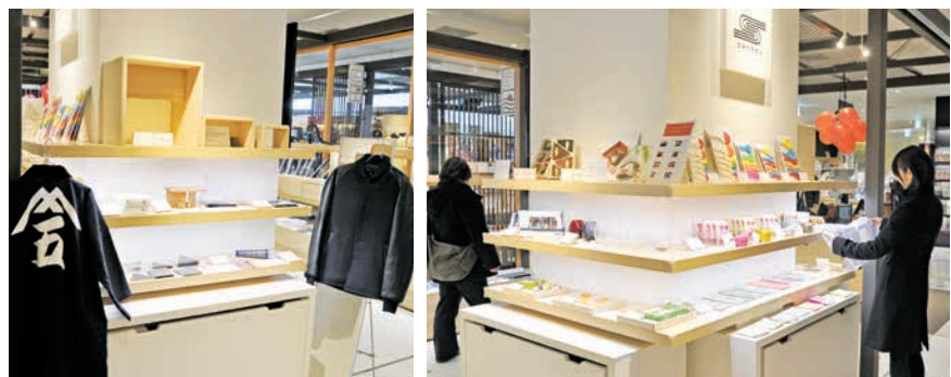
産業観光プラザ すみだ まち処(押上1-1-2東京ソラマチ®5階)で展示・即売されている、「すみだモダン」2012の認証商品(今号2・3面で紹介)

区内の商品などがもつ魅力を広く国内外にPRし、すみだの知名度を高める取組「すみだ地域ブランド戦略」の一環として、「すみだモダン」2012が認証されました。今号では、飲食店メニュー部門の8メニューを1面で、商品部門の18商品を2・3面でご紹介します。皆さんも、まちへ出掛けて、すみだの魅力があふれる食・モノ・人を感じてみませんか。