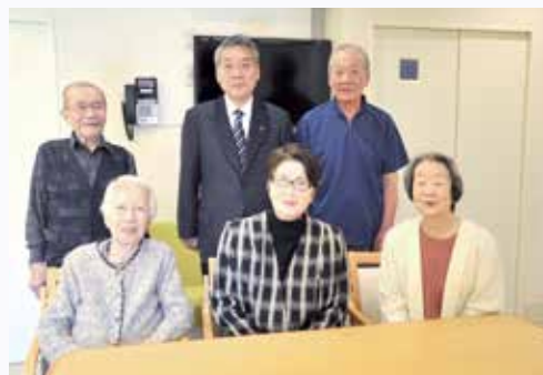
「さんいくハイツ東墨田」の入居者の皆さんと

まだ寒い日が続きますが、梅がほころび始め、少しずつ春の訪れが近づいていることを実感します。