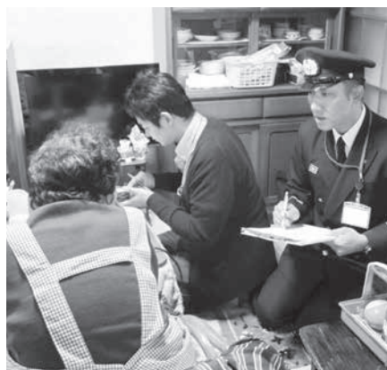
皆さんの防火防災への備えについて、消防署員が丁寧に質問しながら確認しています