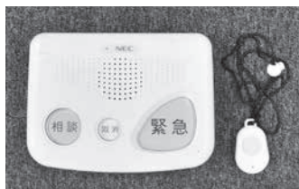
緊急通報システムの専用通報機(左)とペンダント型送信機(右)

【対象】 区内在住の65歳以上で、固定電話をお持ちの方 *費用等の詳細は申込先へ 【申込み】 随時、高齢者福祉課高齢者相談担当(区役所4階) ☎5608-6920 または、お住まいの地域を担当する高齢者みまもり相談室へ