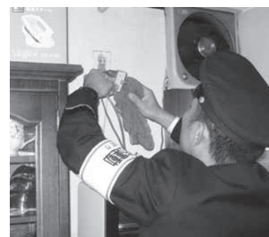
高齢者には手が届きにくい高い場所のホコリも、火災につながる可能性があるため、丁寧に拭き取ります