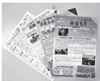
相談室と地域との情報交換にも使われています

【配布場所】 各みまもり相談室、高齢者福祉課(区役所4階)、協力医療機関等 *町会・自治会、老人クラブ、民生委員などでも配布 【問合せ】 お住まいの地域を担当する高齢者みまもり相談室