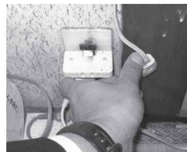
防火防災診断で、焼け焦げたコンセントが見つかりました

今後も、多くの方に「防火防災診断」をご利用いただき、安心して暮らせるまちをつくっていきます。