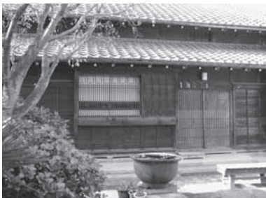
細い木割りの格子戸や獅子窓、黒漆喰壁など、見所満載です

区指定文化財の「立花大正民家園 旧小山家住宅」(立花6-13-17)は、庭園・住宅部分を見学できるほか、住宅部分の有料利用もできます。 江戸時代の農家と町家の雰囲気、今に伝える古民家に、ぜひ、お立ち寄りください。 【庭園・住宅部分の見学】 【開園時間】▶庭園部分▶午前9時～午後4時半 ▶住宅部分▶午後0時半～4時半 *住宅部分は、有料利用がないときのみ見学可【見学料】無料【申込み】当日直接会場へ 【住宅部分の有料利用】 【利用日時・利用料(1棟)】月曜