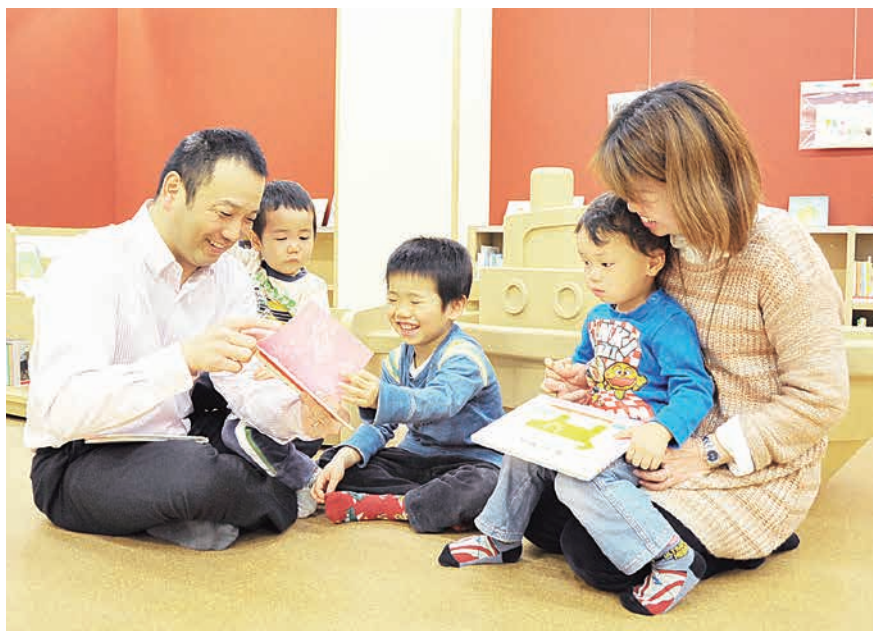
親子でくつろげる「はだしのコーナー」は子育て世代の交流の場にもなります