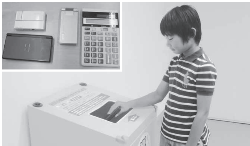
一人ひとりの心掛けで循環型社会を実現しましょう

活用しているところです。一方、不用となった携帯電話やデジタルカメラ、ゲーム機等といった小型家電製品は、再利用できる貴重な金属類が多く含まれているにもかかわらず、燃やさないごみとして処理されているのが現状です。そこで国では、再利用できる金属類を可能な限り回収し、リサイクルを進めるため、「小型家電リサイクル法」を、今年4月に施行しました。併せて、使用済小型家電製品を、自治体において、効果的・効率的にリサイクル回収できるかどうかを検証するための事業を、自治体を選定して行うこととしました。