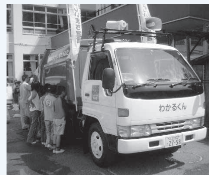
環境啓発車「わかるくん」

ごみの処理を身近に感じるとともに、ごみの正しい分別や減量方法などを学んでみませんか。