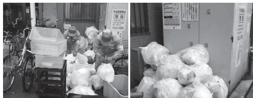
収集職員が集積所の環境改善に取り組んでいます