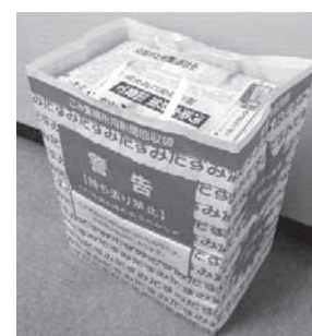
持ち去りのされない対策を(左:持ち去り防止シート・右:新聞専用回収袋)