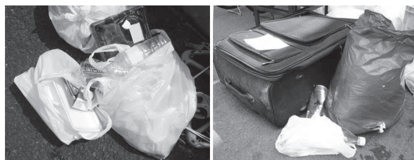
資源物とごみの正しい分別排出をお願いします