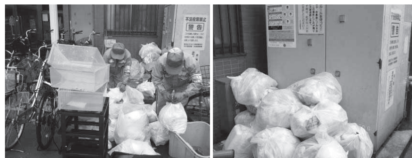
収集職員が集積所の環境改善に取り組んでいます