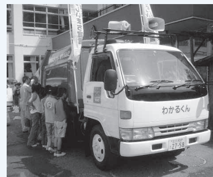
環境啓発車「わかるくん」

ごみの処理を身近に感じるとともに、ごみの正しい分別や減量方法などを学んでみませんか。