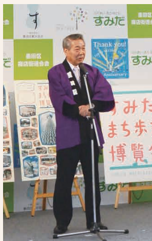
すみだの魅力を発信する様々な取組で、地域の活性化をめざします。

1年を締めくくる月となりました。今年は、初夏の少雨による水不足や、ゲリラ豪雨・台風を原因とする洪水・土砂崩れなど、水に関わる危機・災害が多く発生しました。すみだでも、隅田川花火大会が豪雨により開始直後の中止を余儀なくされました。