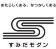
あたらしくある。なつかしくある。