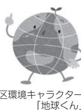
墨田区環境キャラクター「地球くん」