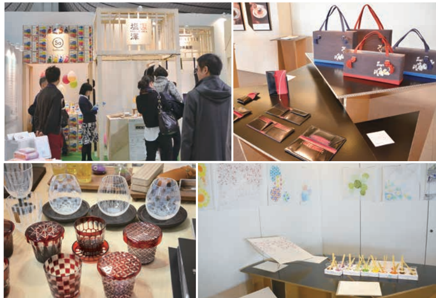
来場者の方々に「すみだモダン」の魅力に触れていただきました

また、3月15日・16日には渋谷区猿楽町で、新たにブランド認証された商品を含む「すみだモダン」の展示会を行いました。展示に加え、ハンカチ友禅染と風船遊びの「ものづくりワークショップ」を開催し、来場した方々に「すみだモダン」の魅力をPRしました。