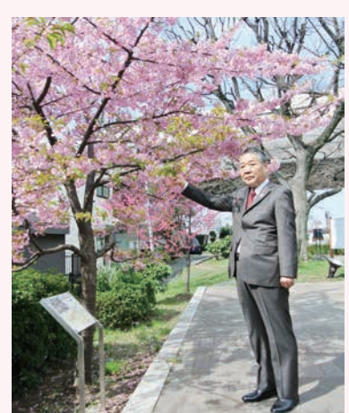
皆さんからの寄付により植樹した様々な桜を見に来ませんか

今日から4月、いよいよ桜のシーズンの到来です。すみだには、「墨堤の桜」として広く親しまれている、区内でも有数の桜の名所があります。「墨堤の桜」は、江戸幕府八代将軍・徳川吉宗による本格的な植樹が起源であると言われていました。その後、洪水による流失などに遭いながらも、地域の方々による植え替えなどを繰り返し、今日まで大切に引き継がれています。 区では、今からちょうど10年前の平成16年、経年による枯死や樹形の乱れなどの問題を抱えていた「墨堤の桜」を元気にし、桜の名所として新たな魅力を備えた環境をつくる「墨堤の桜の保全・創出事業」に着手しました。この事業の特徴は、新しい桜の植樹等の費用