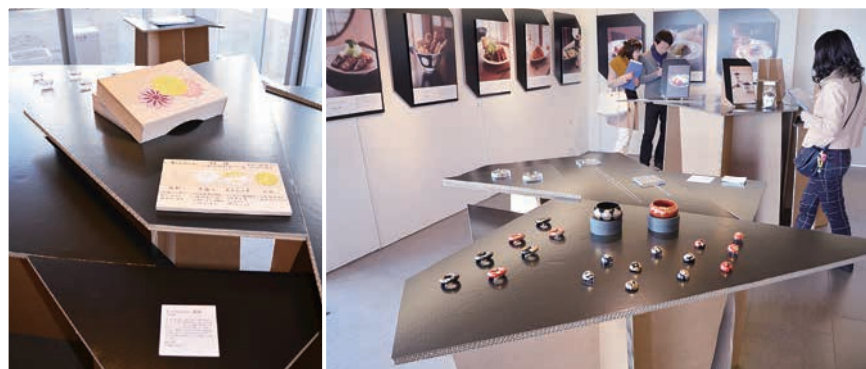
展示会などを区内外で開催し、「すみだモダン」を積極的にPRしています

すみだならではの優れた商品等の魅力を広く提供・発信することなどで、すみだの知名度をより高める活動「すみだ地域ブランド戦略」の一環として、「すみだモダン2013」がブランド認証されました。今号では、飲食店メニュー部門の8メニューを1面で、商品部門の15商品を2・3面でご紹介します。すみだの食・モノ・人の魅力を感じに、出掛けてみませんか。