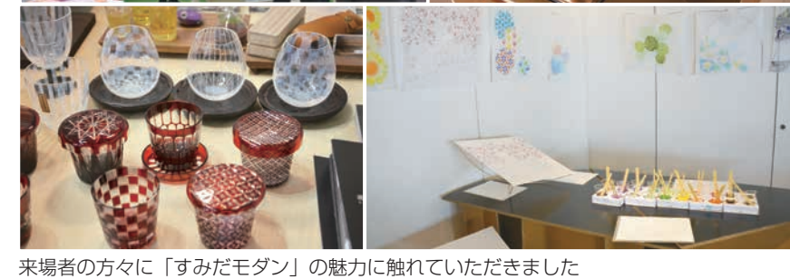
来場者の方々に「すみだモダン」の魅力に触れていただきました