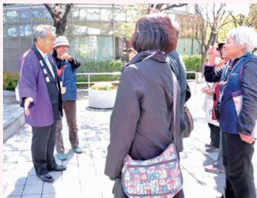
様々なテーマで、すみだの見所を巡るツアーがたくさんあります

新年度となり1か月が経過し、新入生や新社会人の皆さんのはつらつとした姿を見かけることが多くなりました。瑞々しい新緑や柔らかな日差しとも相まって、まちに出ると心が弾むようです。外出には絶好のこの季節に、皆さんが暮らすこのすみだのまちを、ぜひ、散策してみてください。