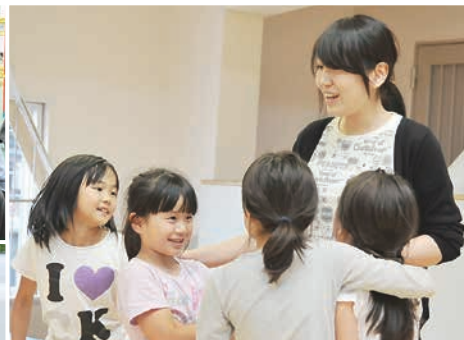
【左上】小学校の集会室に地域の方が集まり、交流する拠点型「ふれあいサロン」活動(活動の一環として、小学生の朝顔の種まきをお手伝いしました) 【左下】車いすごと乗れる自動車「ハンディキャブ」の運転ボランティア活動 【右】学童クラブでの育成補助ボランティア活動

力して「すみだ地域福祉・ボランティアフォーラム」を開催します。地域福祉活動やボランティア活動に関するパネルディスカッション、様々なテーマで参加者同士が語り合う分科会など、地域福祉活動の魅力を知ることができる内容となっています。このフォーラムへの参加をきつ