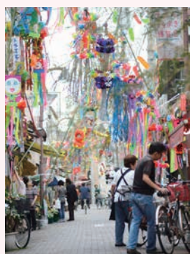
「七夕まつり」(今年は7月4日～7日に開催予定)の様子

しあい豊かな街づくりに貢献する「商店街憲章(キラキラのきめごと)」を定めたことなどが高く評価されました。