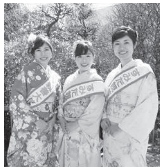
第14代すみだ親善大使

不可 1年を通じて区の公式行事や地域の行事(年20回程度・謝礼あり)に参加し、PR活動等に協力できる方 ほかの地域の親善大使等に就任していない方 *性別や国籍、既婚・未婚の別は不問