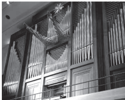
トリフォニーホール自慢のパイプオルガン

【入場料】無料【問合せ】すみだトリフォニーホール(〒130-0013錦糸1-2-3) ☎5608-1212・☎oubo@triphony.com