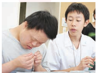
すみだ障害者就労支援総合センターでの施設利用者との交流