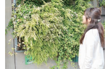
直射日光を遮り、壁面の温度上昇を抑制する壁面緑化

*上記6項目の行動指針は、全15項目からなる「すみだ やさしいまち宣言 私たちの行動指針」から抜粋