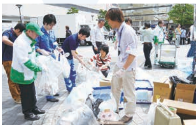
区内を一齐に清掃するクリーンキャンペーン