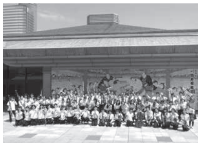
トリフォニーホール・ジュニア・オーケストラ

コンサートホールで音楽を聴く機会が少ない、小さなお子さんとその保護者や、障がいのある方、お腹の中の赤ちゃんに生の音楽を届けたいお父さん・お母さんに楽しんでいただくためのコンサートです。迫力のオーケストラ・サウンドを最高の音響空間でお楽しみください。