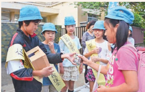
小学校正門前で募金活動を行う児童

集めた義援金は日本赤十字社を通じ、被災された方々へ届けられます。活動を行った児童は「広島県の人たちが笑顔になって欲しい」と想いを語っていました。