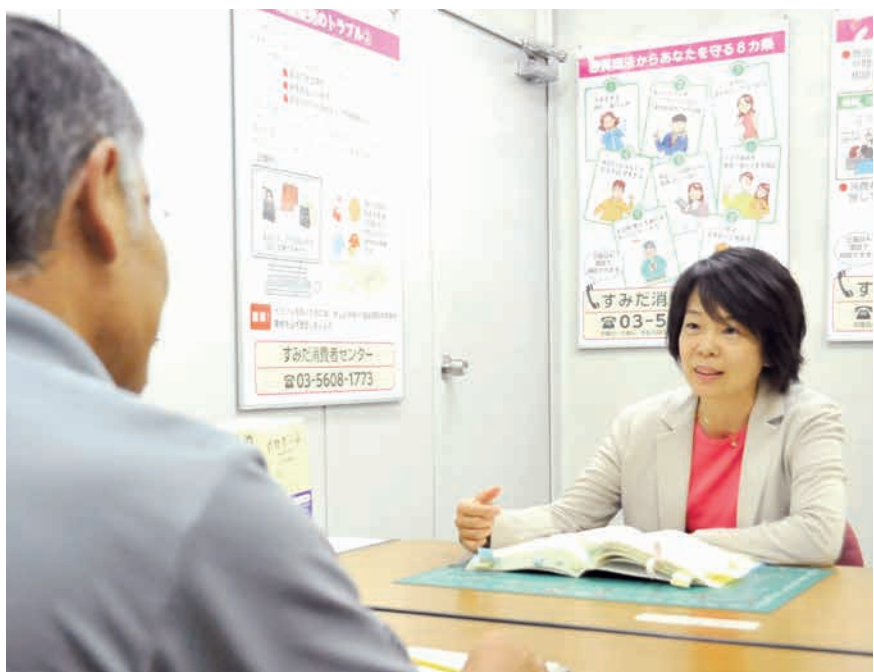
すみだ消費者センターでは、消費生活に関する相談等を行っています