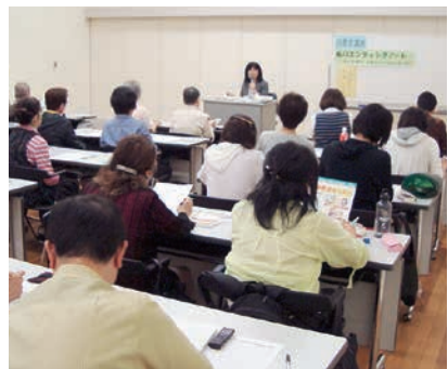
「消費者講座」では、日ごろの消費生活に役立つ様々な情報を提供しています