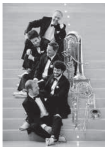
カナディアン・ブラス

て、公演当日にカナディアン・ブラスと一緒に演奏する「ワークショップ」を開催しますので、詳細はお問い合わせください。