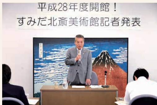
「すみだ北斎美術館」の平成28年の開設に向け、PR活動などにも力を入れていきます

早いもので、平成26年も1か月を残すのみとなりました。今年は8月以降、都内を中心にデング熱が流行し、隅田公園で感染した疑いがある事例も発生しました。こうした事態に対しては、区などが発信する情報を基に、的確な行動をとるようお願いします。