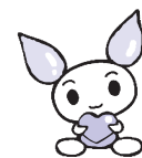
献血キャラクター「けんけつちゃん」

【問合せ】▶東京都赤十字血液センター ☎5534-7550 ▶保健計画課保健計画担当 ☎5608-6189