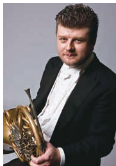
ラデク・バボラーク

世界的オーケストラ、ベルリン・フィルの元首席ホルン奏者として、ホルンという楽器の限界を超えた技巧とスケール感で世界中の音楽ファンを魅了し続けるバボラーク。前半はピアノとのデュオ、後半は新日本フィルとの共演で、贅沢な一夜をお楽しみください。