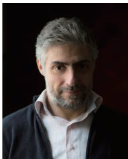
ジョバンニ・ミラバッシ

これまで、すみだトリフォニーホールで数々の美しいメロディとピアノの響きを聴かせてくれたミラバッシが、今回は『風の谷のナウシカ』、『ハウルの動く城』、『天空の城ラピュタ』等、アニメの音楽を取り上げます。まるで生まれ変わったようなアニメ音楽の美しさをお楽しみください。