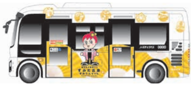
電気バス「すみりんちゃん」

北西部ルートと北東部ルートで共用していた③ 飛木稲荷神社入口④ たらばし児童遊園は、北東部ルートのための停留所となります。