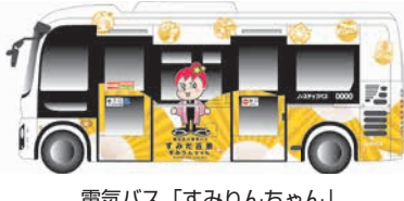
電気バス「すみりんちゃん」

北西部ルートと北東部ルートで共用していた③ 飛木稲荷神社入口④ トラバシ児童遊園は、北東部ルートのための停留所となります。