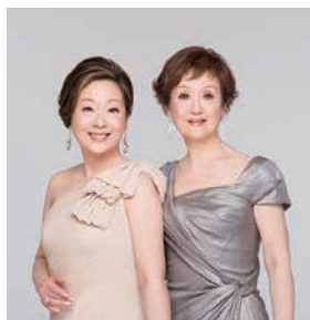
由紀 さおり ・安田祥子

時代を超えて、いつまでも忘れられない歌があります。大切にしたい美しい日本語の歌の数々。思い出や情景、喜び、感動を2人の美しいハーモニーとオーケストラのサウンドに乗せてお届けするコンサートを、どうぞお楽しみください。