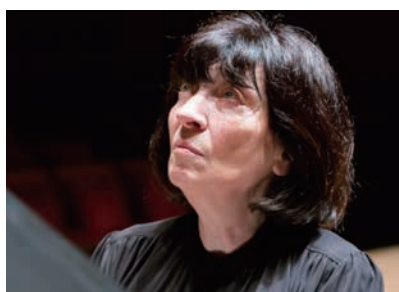
エリソ・ヴィルサラゼ

ンの「謝肉祭」など、親しみやすいながらも、その実力を存分に味わえるプログラムを披露します。世界的なピアニストの公演をぜひ、堪能してください。