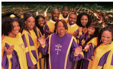
グローリー・ゴスペル・シンガーズ