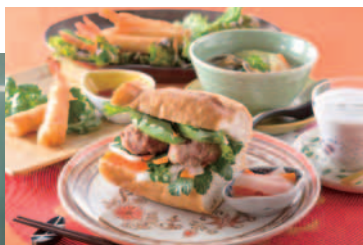
第5回で作るベトナム料理

【第5回「エコ・クッキング」へ】12月3日(木)午後2時～4時 【場所】すみだ環境ふれあい館(文花1-32-9) 【定員】25人 【費用】無料 【対象】区内在住の勤労者の方 【申込み】11月11日午前9時から環境保全課環境管理担当(区役所14階) ☎5608-6209へ