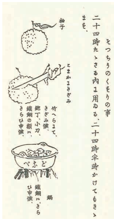
薬の作り方 飯島虚心著『葛飾北斎伝』より