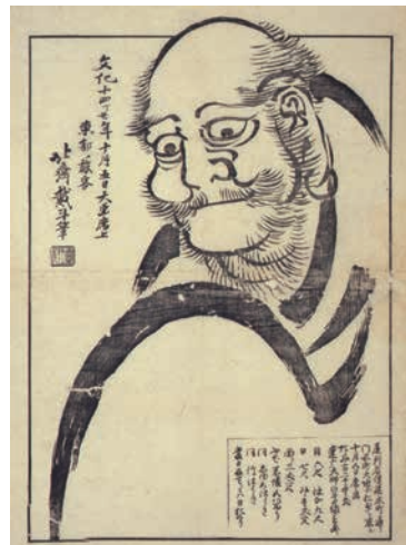
名古屋でのパフォーマンスを知らせる摺物「北斎大画即書引札」(名古屋市博物館蔵)

名古屋では、酒樽に満たした墨汁に筆の代わりのほうきを浸し、助手を務めた弟子たちとともに巨大な紙の上を駆け回ったと言われていています。さらに本所合羽干場(現在の東駒形付近)では大きな馬を、回向院(現在の両国2丁目)では巨大な布袋を描きました。回向院では、米一粒に2羽の雀を描くという“極小絵”パフォーマンスも披露したとされています。