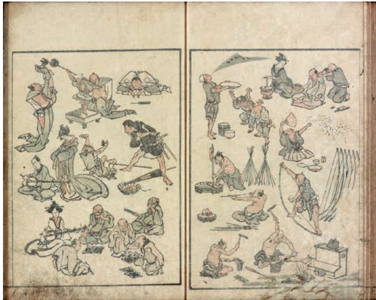
版本『伝神開手 北斎漫画』初編

北斎は多くの絵手本(絵の描き方の教科書)を手掛けましたが、その代表作が『北斎漫画』です。“漫画”とは、気の向くままに色々なものを描くという意味で、人、動植物から、魚、昆虫、建築、風景、果てはお化けまで、ありとあらゆるものが収められています。『北斎漫画』は、日本からフランスに輸出された陶磁器の“包み紙”に使われており、それが偶然に芸術家の目に触れ、印象派の画家たちにジャポニスムが広まるきっかけとなったと言われています。