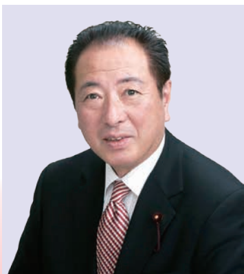
墨田区議会議長 樋口 敏郎