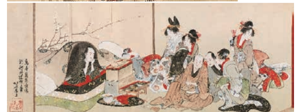
【上】両国橋付近 【下】吉原室内