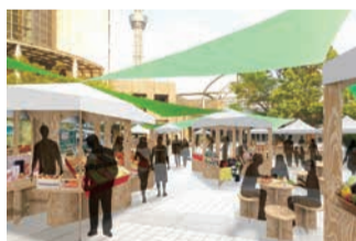
【THE GREENMARKET SUMIDA】 会場イメージ

地域の事業者や商店街の皆さんのほか、全国から出店者を招き、区役所前うるおい広場で産直市を開催します。すみだの伝統工芸や名品をはじめ、全国の農産物等を販売するほか、キッチンカーの絶品グルメも楽しめます。 【とき】9月24日(土)・25日(日) 午前10時～午後4時 *11月以降、原則、毎月第1土・日曜日に開催(1月を除く) 【入場料】無料【申込み】当日直接会場へ