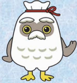
シルバー人材センターのゆるキャラ「チエブクロー」

墨田区シルバー人材センターでは、皆さんが日常生活を快適に過ごせるように、 家事援助(生活支援)サービス を提供しています。