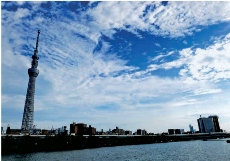
「台風去りてさわやか」

青空や夕焼けなど、様々な“すみだの空”の写真が届きました。ここでは、応募があった写真の一部をご紹介します。