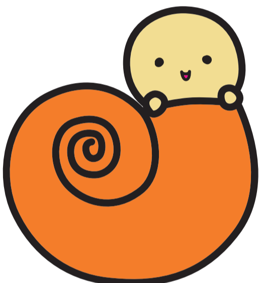
児童虐待防止推進キャラクター OSEKKAIくん

児童虐待を未然に防止するためには、親が子育ての悩みや、家庭の不和・周囲からの孤立によるストレスを抱えたときに、友人や近隣の方など、誰かに相談できる状況にあることが大切です。今号1面では、子育て中の方が利用できる相談窓口と、同じ地域に住む方が虐待を防止するためにできることをご紹介します。