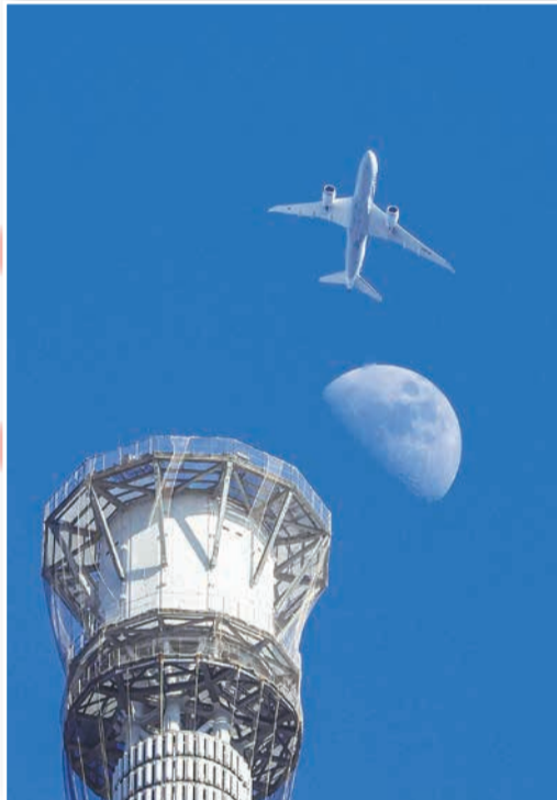
「青空のスリーショット」

たくさんのご応募、お待ちしております 次回1月1日号は、元日号特別企画「すみだの夢」作品展を開催！