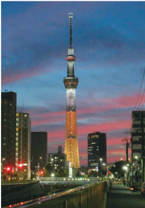
「夕焼けとスカイツリーのコラボ」