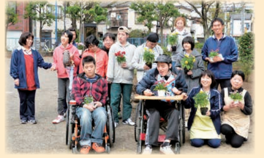
公園の花壇を手入れしている、障害者生活介護施設すみだステップハウスおおぞら「ひだまり」のみなさん

差などの物理的バリア(障壁)や障害のある人に対する社会の理解不足といった心のバリアを取り除き、障害や障害のある人に対する正しい理解と知識を普及し、ノーマライゼーションの考え方を浸透させる必要があります。