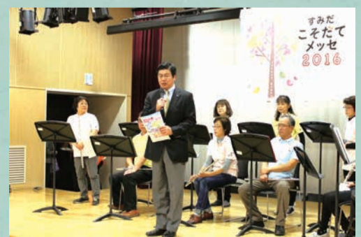
子育て中の人と子育てを応援したい人とをつなぐ「すみだ子育てメッセ2016」を開催しました

これから寒さが厳しくなります。慌ただしい年の瀬ですが、健康にご留意され、良い年をお迎えください。