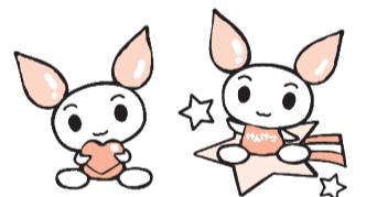
献血キャラクター「けんけつちゃん」