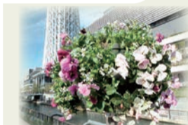
ハンギングバスケット