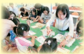
エコライフサポーター