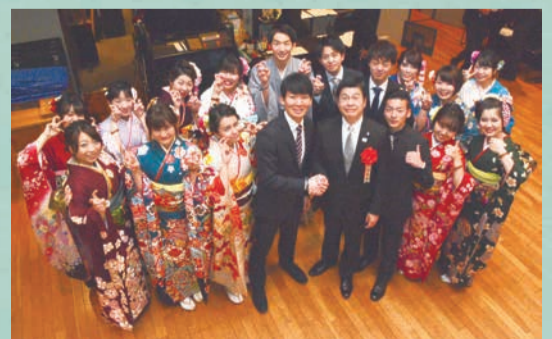
成人を祝うつどい実行委員の皆さん、すみだらしい思い出深い式をありがとうございました。

大学誘致により新たなつながりが生まれ、本区がさらに発展していくよう、これからも全力でまちづくりに取り組んでいきます。